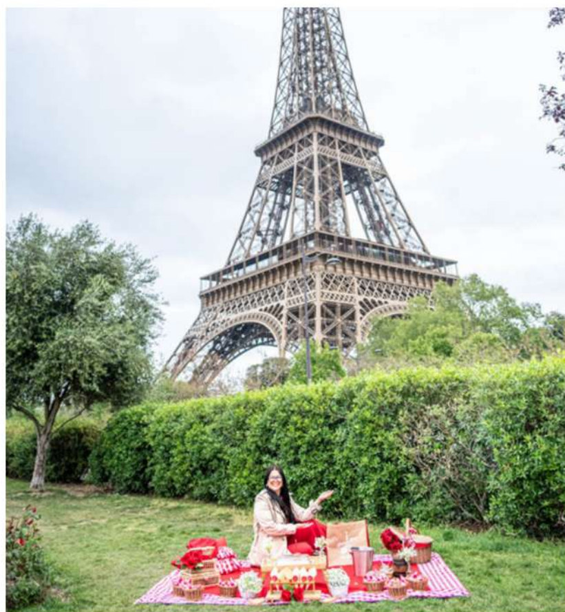
JARDIM LATERAL DO CARROSSEL

FOTOS MERAMENTE ILUSTRATIVAS PARA INSPIRAR VOCÊ A ESCOLHER O LOCAL. AS DUAS FOTOS DA ESQUERDA, SÃO FOTOS DOS NOSSOS PICNICS DE LUXO E NÃO DO KIT PEGUE E MONTE. AINDA NÃO RECEBEMOS FOTOS DE CLIENTES NO PEGUE E MONTE.