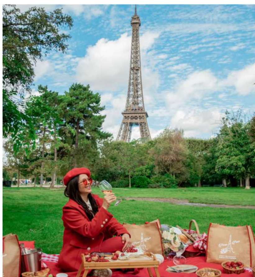
LATERAL DIREITA DOS CHAMPS DE MARS