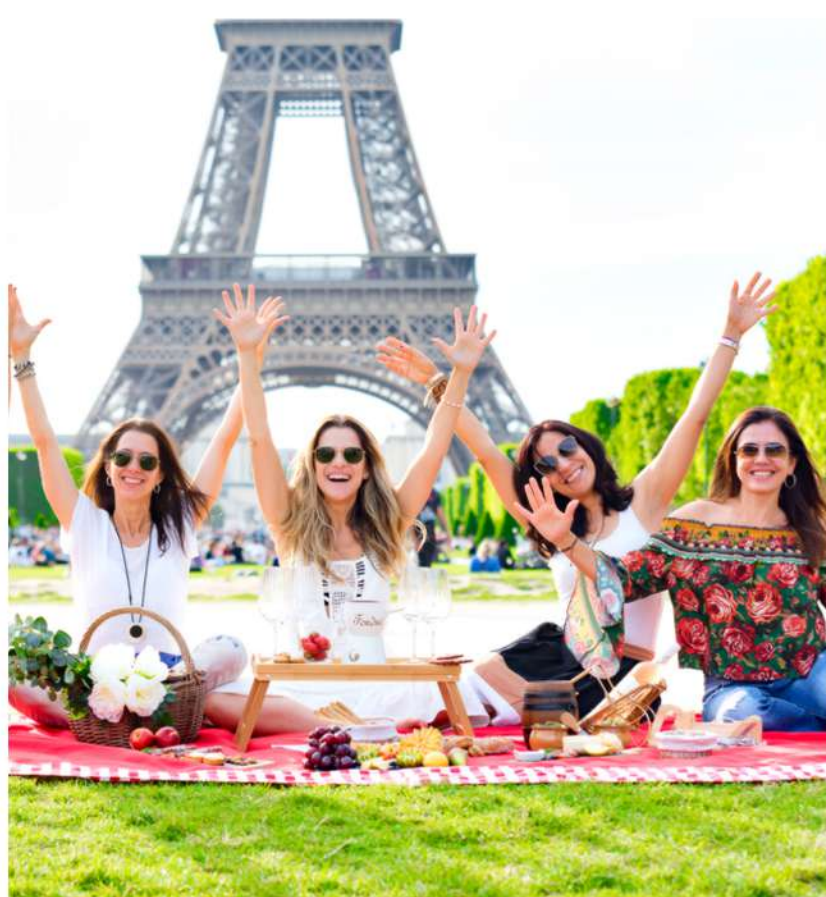
CHAMPS DE MARS

VOCÊ TERÁ 3 HORAS PARA MONTAR, TIRAR MUITAS FOTOS E CURTIR SEU PICNIC PARISIENSE.